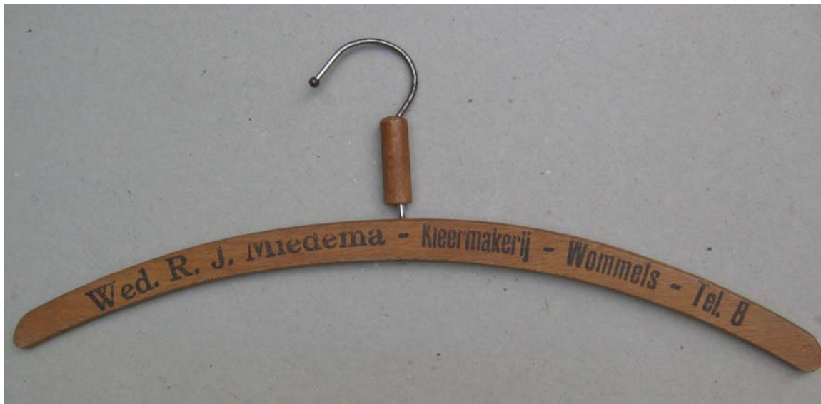
Het Miedema-kleerhangertje met telefoonnummer 8