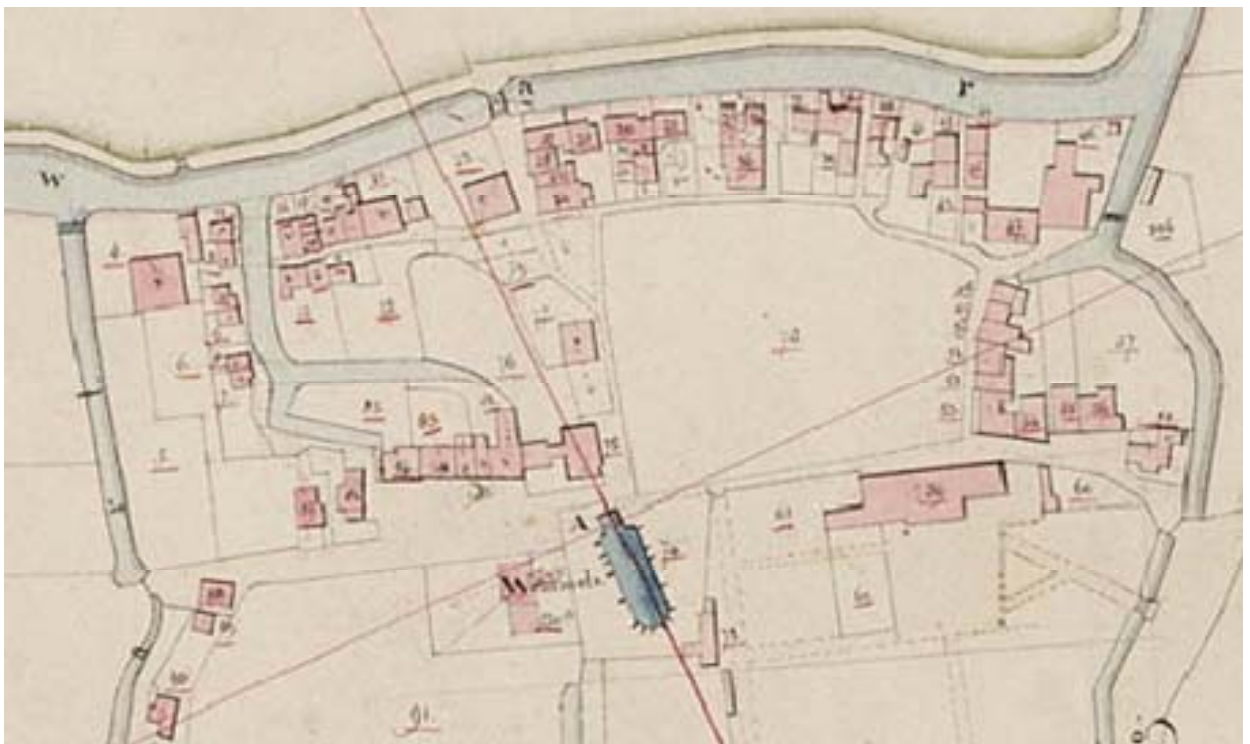
Wommels op de kadasterkaart van 1832

1644-1660: Voor deze periode ontbreken proklamatieakten.