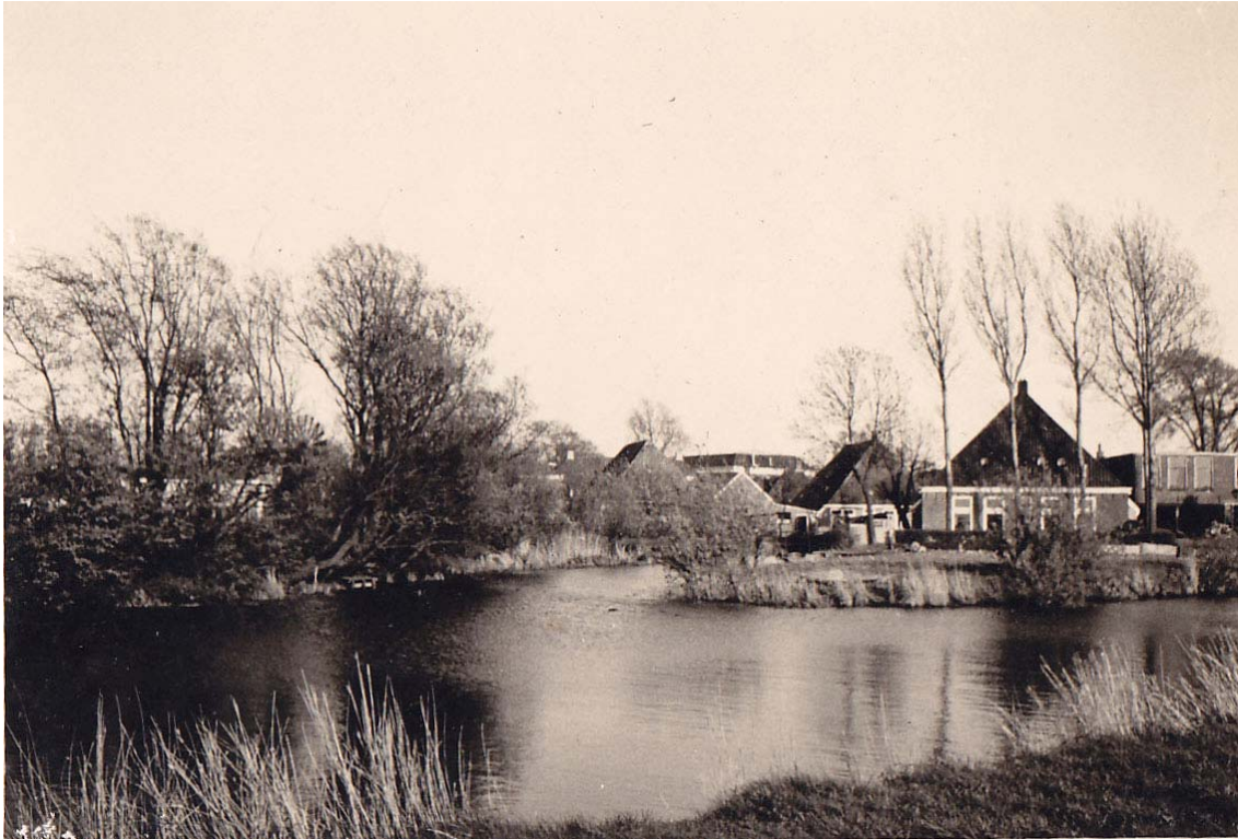
Rechts van het midden de hoek Trekvaart – Noorderhaven, perceel 46 op de kadasterkaart van 1832. Helemaal rechts het ‘Hemeltsje’. In het midden op de achtergrond de ‘Klompebuurt’, met daarachter het platte dak van het huidige café-restaurant ‘It Reade Hynder’. Links ‘it hôf’ van Tjerk Postma, nu een jachthaven (foto JM ca. 1962)