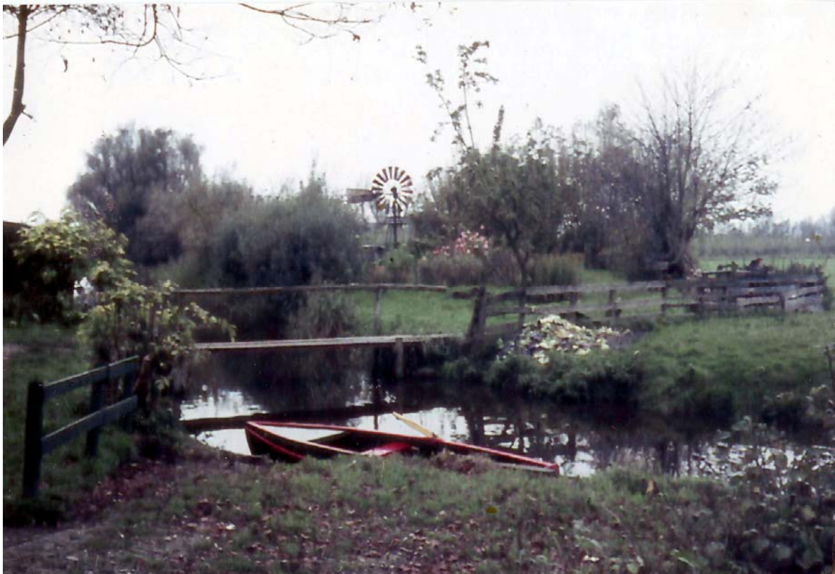
De Noorderhaven in de jaren '60 van de vorige eeuw, met een roeibootje van eigen makelij. Op de achtergrond 'it hôf' van Tjerk Postma