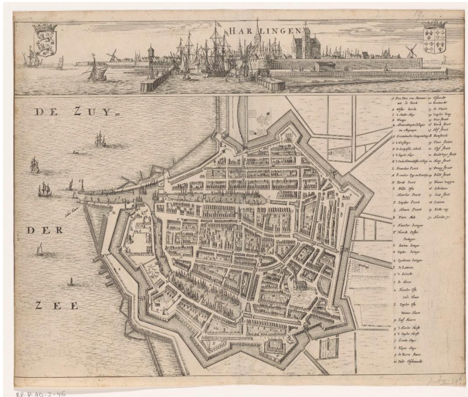
Plattegrond van Harlingen, met stadsgezicht, mogelijk door Jacob van Meurs, 1664 (collectie Rijksmuseum Amsterdam, RP-P-AO-2-46)