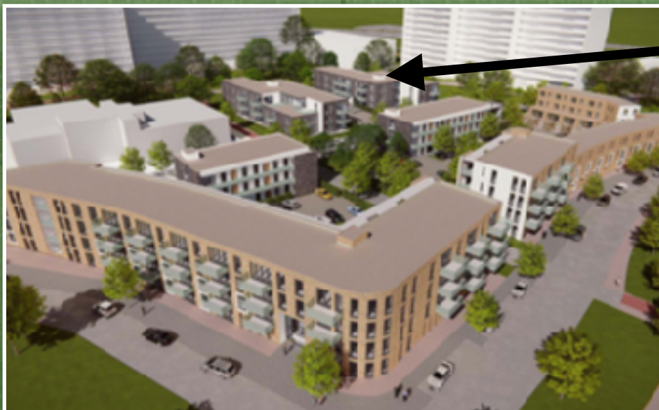
Impressie Zonnehof nieuwbouw

Dit is de 'foute' flat, die 40% overschrijding veroorzaakt en nu op 50 meter van Saturnus getekend staat